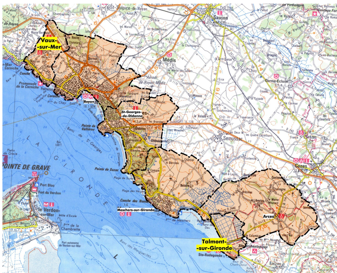
Carte de situation des communes pour l'élaboration des études de ce PPR

Les communes d'Arces et de Talmont-sur-Gironde ne sont pas concernées par l'analyse sur l'aléa Incendie de forêt car aucun massif boisé significatif n'est présent sur leur territoire communal.